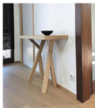
Une console au style épuré.