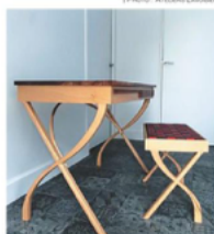
L'écriture et son banc à damier.