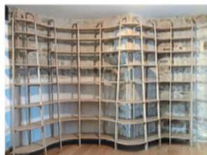
Une bibliothèque sur-mesure, toute en courbes et légèreté.

Ateliers Lavoisier (Emmanuel Thoby) à suivre sur Facebook, Tél. 07 81 00 70 90. ateliers.lavoisier@gmail.com